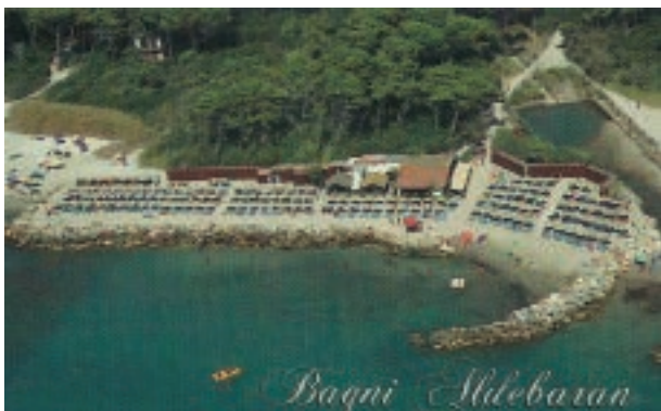
BAGNI ALDEBARAN loc. Molino a Fuoco la Mazzanta di Vada (LI) tel./fax 0586.77.01.54